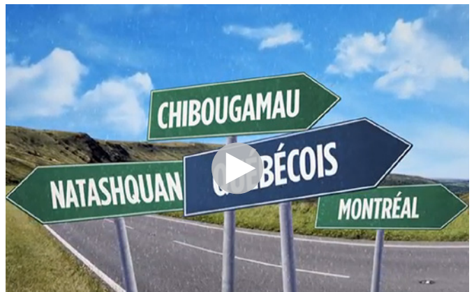
Pour visionner la vidéo: visitez la rubrique Vidéos du site nego2015.org

Le gouvernement propose aussi de geler l'enveloppe globale des disparités régionales et d'éliminer la prime de rétention de 8% accordée, depuis la fin des années 1960, aux employées et employés de Sept-Îles, de Port-Cartier, de Gallix et de Rivière-Pentecôte. Ce faisant, il aggraverait les problèmes déjà criants d'attraction de la main-d'œuvre, tout en portant un dur coup à la vitalité économique de l'ensemble de la région.